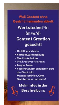
Auflösung mit Stelleninfos