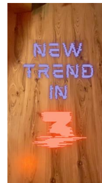
Intro: Countdown New Trend + Sound Effect