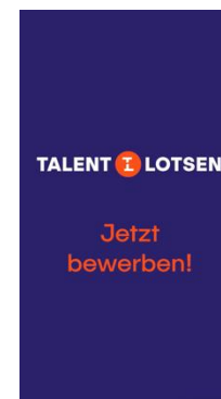
Endcard mit CTA