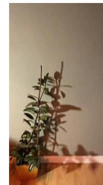
Leere Wand, dann Freeze Frame mit Glitch Effect und Start Voice Over